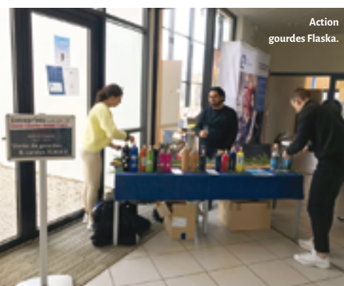
Action gourdes FLASKA.

Option ENTREPRENEURIAT L'un des seuls établissements des Pays de la Loire à proposer cet enseignement !